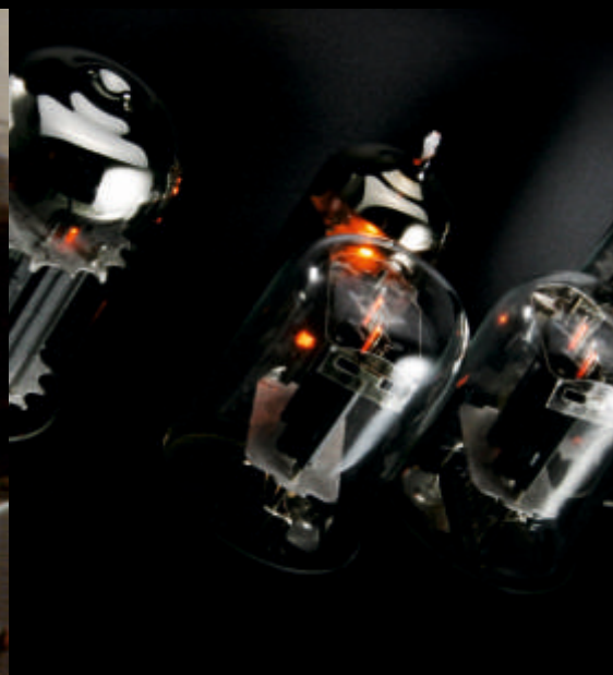
Поколения ламп (слева направо): Quad II, QA12/P и RA One ▲