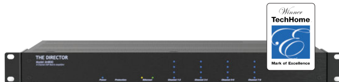
THE DIRECTOR MODEL M4800 | 8 КАНАЛОВ | 100Вт НА КАНАЛ