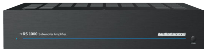
RS 1000 | УСИЛИТЕЛЬ ДЛЯ САБВУФЕРА С DSP УПРАВЛЕНИЕМ

Усилители для сабвуфера с DSP управлением AudioControl RS 1000 и RS 500 являются самым лучшим решением для звукоусиления любого домашнего кинотеатра, многозонной или 2-канальной музыкальной системы. Усилители серии RS обладают высокой мощностью и могут стабильно работать с нагрузкой 2 Ом. Как и вся остальная продукция AudioControl, усилители серии RS поддерживают управление по сети и ИК, а также выходы с опциональным фильтром высоких частот. Широкоизвестный фирменный DSP от AudioControl включает в себя графический и параметрический эквалайзеры, кроссовер с возможностью регулировки задержки и фазы, функцию калибровки и тонкой настройки. Все эти функции и особенности делают усилители серии RS однозначным выбором для звукоусиления сабвуфера в развлекательной системе, которая требует самого лучшего качества.