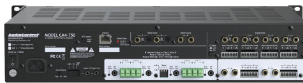
CM4-750 | ЗАДНЯЯ ПАНЕЛЬ