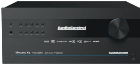
MAESTRO X9 | 9.1.6 AV-ПРЕДУСИЛИТЕЛЬ-ПРОЦЕССОР

AV-ПРОЦЕССОРЫ И РЕСИВЕРЫ ОБЪЕМНОГО ЗВУКА