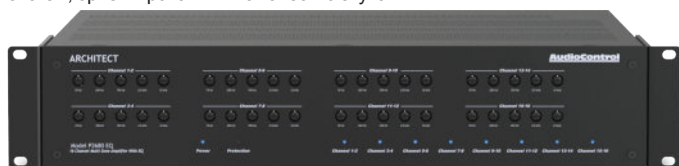
ARCHITECT MODEL P2680 EQ | 16 КАНАЛОВ | 100ВТ НА КАНАЛ | ЭКВАЛАЙЗЕР

Когда необходимо оснастить весь дом высококачественным аудиооборудованием, а физическое пространство не позволяет этого сделать, на помощь приходят усилители AudioControl серии Architect. Вам всего лишь нужно одно или два места в рэковой стойке, чтобы установить наши высокоомощные усилители. Удобное переключение входов, высокий уровень защиты, а также набор функций, облегчающий установку, делают усилители серии Architect идеальным решением для систем, ориентированных на качество звучания.