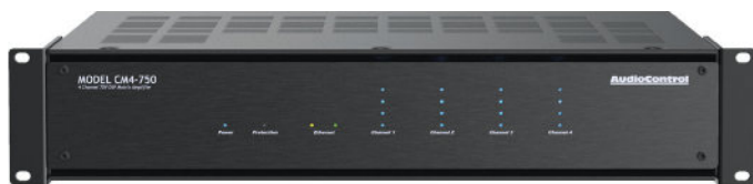
CM4-750 | 4 КАНАЛА | 750ВТ НА КАНАЛ | 70В/8Ω ДВОЙНОЙ РЕЖИМ

Вы можете выбрать балансные/небалансные аналоговые выходы, вход для микрофона или цифровые входы. Выходы можно настраивать по отдельности или парами (стерео), что дает интеграторам определенную гибкость при конфигурации системы для любой зоны. Для максимальной эффективности настройка и диагностика системы может осуществляться удаленно через браузер, приложение для компьютера, Mac, iOS или Android.