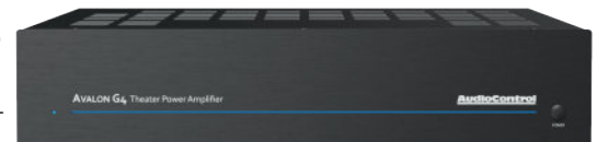
AVALON G4 | 4-КАНАЛЬНЫЙ УСИЛИТЕЛЬ МОЩНОСТИ

Кинотеатральные усилители серии G4 были созданы в качестве идеальной пары для предусилителей-процессоров AudioControl, но также могут использоваться в качестве самостоятельного решения, которое можно легко настроить для чего угодно: от мощной 2-канальной системы до поражающего своей детальностью и динамикой домашнего кинотеатра.