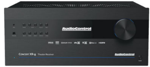
CONCERT XR-8 | 9.1.6 AV-РЕСИВЕР

В процессорах и ресиверах Maestro сосредоточены новейшие технологии в области обработки аудио и видео, полностью поддерживают 4K UHD и воспроизведение HDR, а также оснащены коррекцией звука Dirac Live®. Фанаты оценят интуитивное управление при помощи приложения, поддержку Google Cast, Airplay 2, aptX Bluetooth, потоковое воспроизведение по Wi-Fi и встроенное управление по сети.