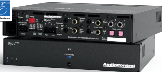
BIJOU 600 | 2-КАНАЛЬНЫЙ УСИЛИТЕЛЬ С ЦАП И УПРАВЛЕНИЕМ ГРОМКОСТЬЮ