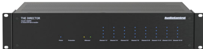
THE DIRECTOR MODEL M6800 | 16 КАНАЛОВ | 100Вт НА КАНАЛ

Усилители серии Director – это одни из самых умных и удобных усилителей для коммерческого и домашнего использования. В каждом усилителе установлен цифровой сигнальный процессор, графический и параметрический эквалайзер зон, предустановлены профили акустики, присутствует мониторинг по сети, есть управление громкостью и группировка по зонам или каналам. Благодаря матричной конструкции усилителей серии Director M любой аналоговый или цифровой сигнал может быть направлен на выход любой зоны, а также на два цифровых коаксиальных выхода. Во всех усилителях Director предустановлены профили акустических систем производителей, входящих в партнерскую программу AudioControl, обеспечивающие быструю калибровку акустики из постоянно растущего списка наших партнеров.