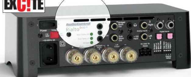
RIALTO 600 | 2-КАНАЛЬНЫЙ УСИЛИТЕЛЬ С ЦАП И УПРАВЛЕНИЕМ ГРОМКОСТЬЮ