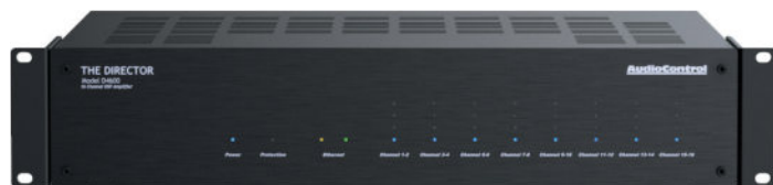
THE DIRECTOR MODEL D4600 | 16 КАНАЛОВ | 100Вт НА КАНАЛ